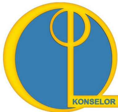
Gambar 1. Logo Konseling

Berikut ini logo konseling di Indonesia: