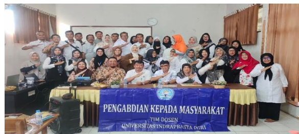
Gambar 3. Sesi foto bersama dengan peserta pelatihan

Berdasarkan hasil pengisian kuesioner pre test dan post test dengan pernyataan yang sama, terlihat adanya peningkatan signifikan pada setiap aspek yang diukur. Tabel berikut menyajikan perbandingan hasil pre test dan post test guru SDN Plawad II setelah mengikuti pelatihan konsep bahasa kasih dalam pembentukan karakter siswa.