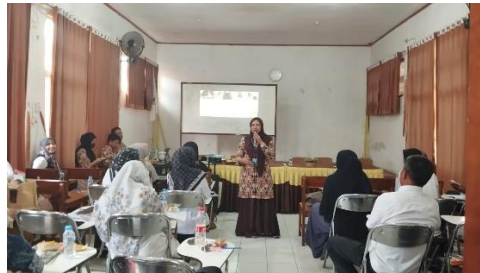
Gambar 2. Pemateri menyampaikan materi tentang peningkatan pembentukan karakter siswa dengan menggunakan konsep bahasa kasih ( love language )

yang positif terhadap materi pelatihan. Kegiatan sosialisasi memberikan pemahaman mendalam kepada para guru mengenai jenis-jenis bahasa kasih dalam konteks pembentukan karakter siswa, baik dari aspek psikologis maupun pedagogis. Para guru juga dibekali cara-cara pendekatan yang tepat kepada siswa di lingkungan sekolah. Dengan pemahaman yang lebih baik, diharapkan guru mampu mengambil langkah cepat dan tepat dalam membimbing pembentukan karakter siswa menggunakan pendekatan bahasa kasih.