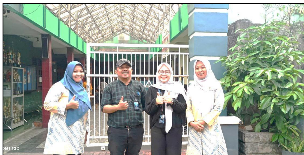
Gambar 4. Penutupan Kegiatan Pengabdian Kepada Masyarakat.