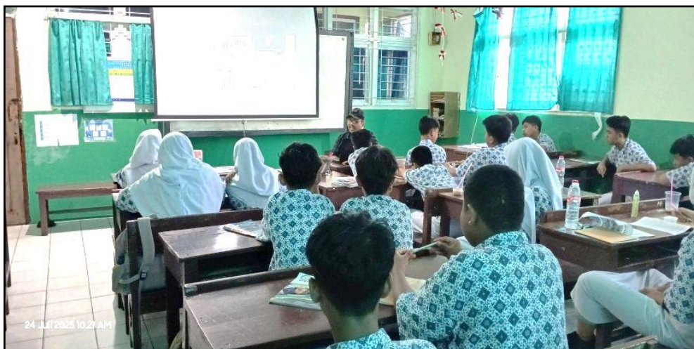
Gambar 2. Sosialisasi Implementasi Nilai-Nilai Pancasila dalam Mencegah Aksi Kenakalan Remaja. Sumber : Dokumen Pribadi