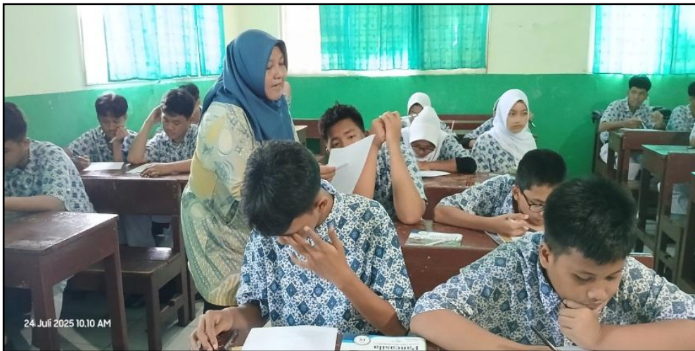
Gambar 1. Pemberian Kuesioner Pre-test Sebelum Sosialisasi.

Berikut terdapat juga beberapa dokumentasi terkait dengan kegiatan Tim Pengabdian kepada Masyarakat Universitas Indraprasta PGRI selama kegiatan sosialisasi berlangsung yang dituangkan pada potret gambar.