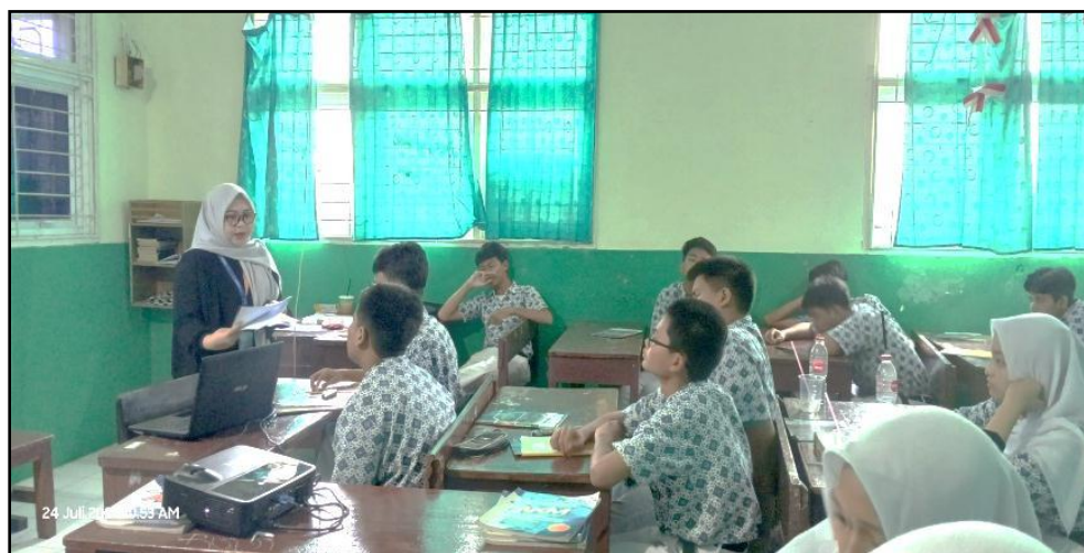
Gambar 3. Pemberian Kuesioner Post-test Setelah Sosialisasi.