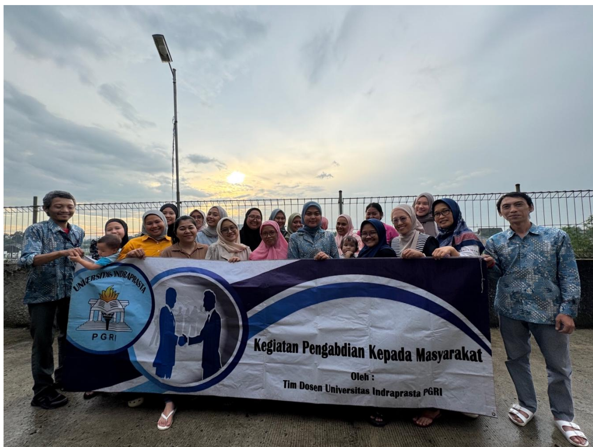
Gambar 3. Foto Bersama Peserta Kegiatan Pelatihan

Secara umum kegiatan pengabdian kepada masyarakat ini dapat dikatakan berhasil. Terdapat tanggapan positif dari peserta mengenai kegiatan pelatihan aplikasi LingoDeer dalam pengembangan literasi digital dan keterampilan bahasa Inggris melalui bimbingan dari ibu-ibu. Jadi, program ini secara tidak langsung juga menyasar anak-anak yang akan menerima manfaat dari keterampilan yang diperoleh ibu-ibu mereka.