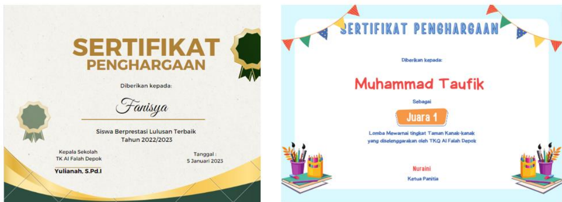
Gambar 3. Contoh Sertifikat Hasil Pelatihan