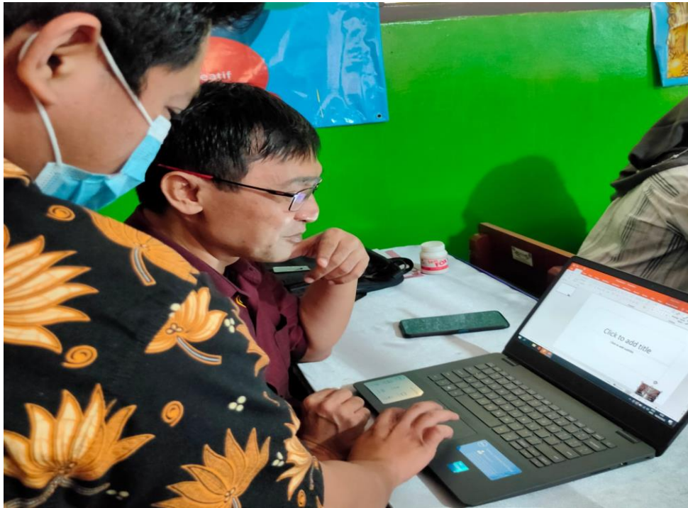
Gambar 1. Pengenalan Microsoft Power Point

Setelah penjelasan dan kegunaan Ms. Power Point kepada guru SDN Jatimekar I Bekasi, pelaksanaan tahap kedua pada tanggal 16 Juni 2022 adalah pencarian template dan gambar secara online . Pelatihan ini dimaksudkan agar peserta dapat mencari dan memilih template dan gambar yang menarik sesuai dengan kebutuhan, namun membutuhkan koneksi internet . Pada Ms. Power Point sudah menyediakan menu template yang sudah tersedia. Para peserta sangat antusias dalam pelatihan tahap kedua ini karena tim abdimas telah menyediakan link resmi template Ms. Power Point.