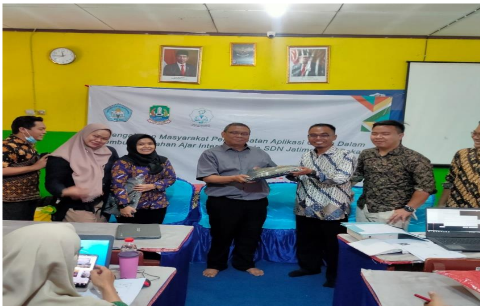
Gambar 5. Pemberian Door Prize