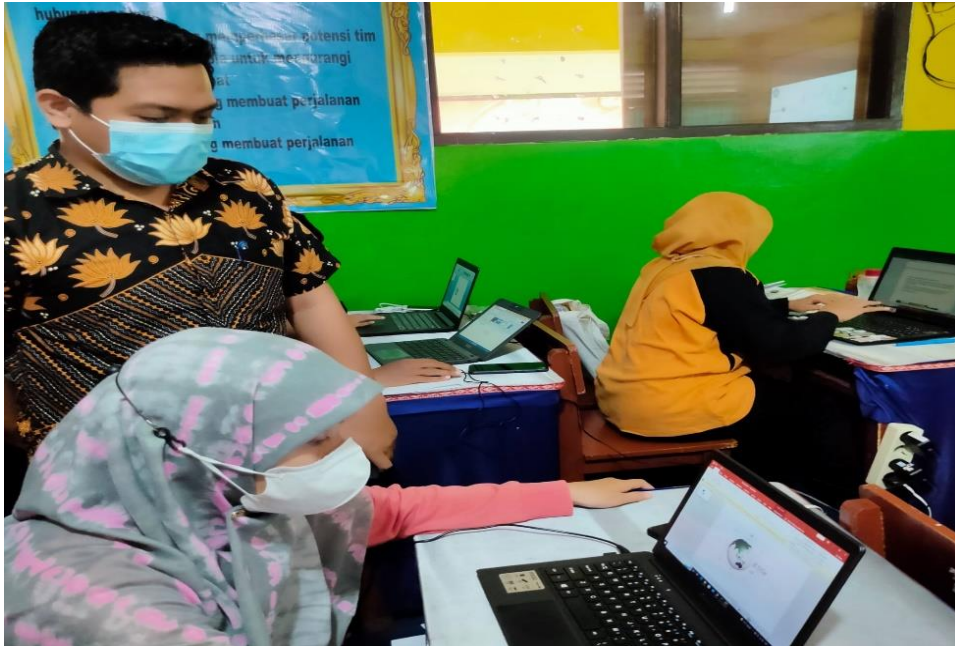
Gambar 4. Pelatihan Perekaman Slide dan Audio