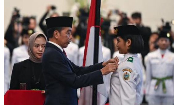
Gambar 2. Penyematan Lencana pada Pengukuhan Paskibraka 2024

berpotensi menimbulkan luka dan rasa ketidakadilan bagi sebagian warga negara, serta melemahkan komitmen bersama dalam menjaga keharmonisan dan persatuan nasional (Sumarno, 2024).