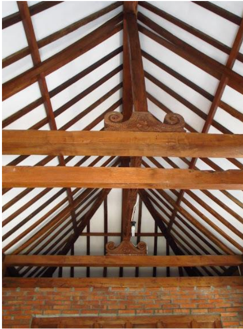
Gambar 3. Desain langit-langit berbentuk segi tiga

ukiran pada pintu gerbang atau ruangan serbaguna.