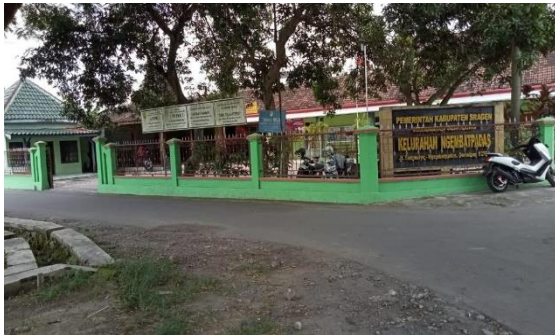
Gambar 1. Kantor Kelurahan Ngembat Padas

dengan selesai (Basrowi dan Siti Juriyah, 2010).