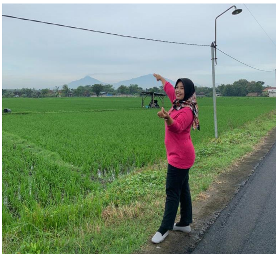
Gambar 1. Areal Persawahan

Berdasarkan uraian di atas, penelitian ini bertujuan untuk menguji apakah tingkat pendidikan formal berpengaruh pada kesadaran masyarakat dalam melaksanakan pembangunan di desa Ngembat Padas, Sragen. Dari hasil penelitian ini nantinya diharapkan akan menjadi bahan pertimbangan bagi para perangkat desa dan pemerintah daerah dalam upaya meningkatkan tingkat pendidikan warga masyarakat desa Ngembat Padas sehingga dengan ilmu yang mereka peroleh nantinya dapat dipergunakan untuk mengembangkan potensi perekonomian dalam bidang pertanian untuk lebih maju kedepannya di desa tempat mereka tinggal.