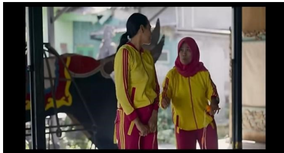
Gambar 6 (Cuplikan adegan Bu Prani di ejek teman senamnya menit 27:52)

Kontrol diri adalah kemampuan seseorang untuk mengendalikan dirinya agar dapat berperilaku dengan cara yang tidak merugikan orang lain, sesuai dengan norma sosial yang diterima oleh masyarakat. Sifat mampu mengendalikan diri merujuk pada kemampuan seseorang untuk mengelola emosi, pikiran, dan perilaku, terutama dalam situasi yang menantang atau emosional. Dalam dunia Pendidikan mengajarkan kontrol diri dapat membantu siswa untuk tetap fokus pada tujuan jangka panjang mereka dan tidak terjebak dalam perilaku impulsif (Budiarto & Helmi, 2021)