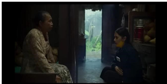
Gambar 7 (Cuplikan adegan Tita mewawancarai Mbok Rahayu menit 47:05)

pendidikan karakter, kasih sayang dianggap sebagai dasar untuk membangun empati, memahami perasaan orang lain, dan mengembangkan kemampuan untuk bekerja sama dalam situasi sosial yang kompleks (Ferrara, 2019).