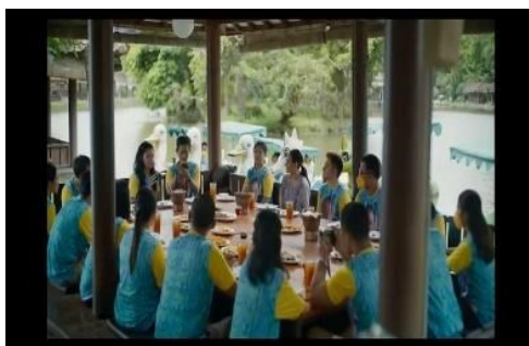
Gambar 8 Cuplikan adegan alumni siswa memberi suport untuk Bu Prani menit 49:27

Ketulusan hati berarti bertindak dan berbicara dengan niat yang murni, sesuai kenyataan tanpa ada kepalsuan atau tipu daya. Kejujuran merupakan salah satu nilai moral yang harus diajarkan kepada siswa agar mereka tumbuh menjadi individu yang dapat dipercaya dan mampu mempertahankan kebenaran meskipun ada banyak tekanan (Baharun & Maryam, 2019). Kejujuran dalam pendidikan karakter akan membentuk individu yang mampu bertanggung jawab atas tindakan dan kata-katanya (Nafsaka et al., 2023).