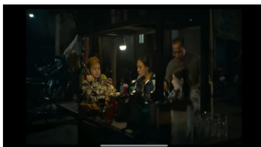
Gambar 4 Cuplikan adegan Bu Prani dan kedua anaknya membahas video yang sedang viral menit 20:19

Kerjasama adalah upaya yang dilakukan untuk mencapai tujuan dan kepentingan bersama. Ini mencakup komitmen untuk saling membantu, berbagi tanggung jawab, dan saling menghargai dalam proses kolaborasi. Kerja sama yang efektif juga mendorong individu untuk lebih menghargai perspektif orang lain, mengurangi stres, dan meningkatkan keterampilan komunikasi (Zajac et al., 2021). Mengajarkan kerjasama melibatkan siswa untuk memahami pentingnya berbagi tanggung jawab dan mengelola perbedaan secara konstruktif. Hal ini menciptakan komunitas yang saling mendukung dan memfasilitasi pencapaian tujuan bersama (Widy Meitha Permata Putri & Nensiliani, 2023).