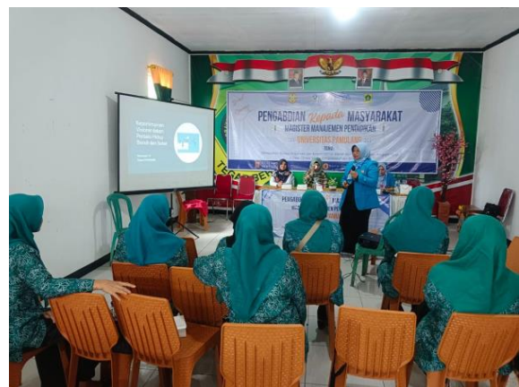
Gambar 2. Kegiatan Peserta

Kegiatan dilanjutkan dengan pengisian survei oleh peserta untuk mengetahui implementasi Perilaku Hidup Bersih Sehat (PHBS) di tingkat rumah tangga masing-masing peserta. Tautan survei terdapat pada https://docs.google.com/forms/d/e/1FAIpQLSf_8Dh6ZexT2gdTquh0vizw912rFcd3zuetY6A_8vnpn6y8Wog/viewform . Kegiatan peserta dapat dilihat pada gambar 2.