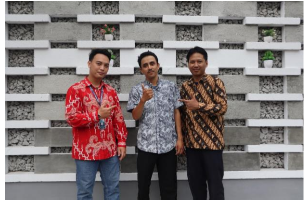
Gambar 2. Persiapan Tim PKM

Pelaksanaan PKM di Rumah PGB Jakarta Timur membuahkan hasil yang sangat memuaskan. Hasil pelaksanaan ini bertujuan untuk menyusun struktur organisasi dan tujuan organisasi Rumah PGB Jakarta Timur.