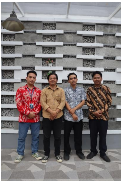
Gambar 1. Anggota Tim PKM

Kegiatan tim abdimas juga di dokumentasikan melalui video dan foto. Beberapa foto tim abdimas saat melakukan kegiatan abdimas di Rumah PGB Jakarta Timur dapat dilihat berikut ini.